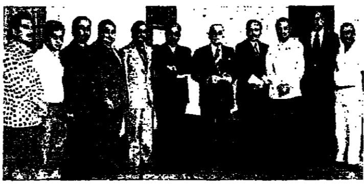
الرئيس سلام يتوسط وفد معلمي القاصد

اعتبر الرئيس قبي الذي اطلع على مجرد وجود جيش لبناني في الجنوب يوقف المؤامرة والتفكير الإسرائيلي. وكان ان وجود قوات دولية على الحدود ان يحل الأزمة. ويوضح الرئيس الصلح والسلي كان يتحدث في ندوة صحفية عقدها في مقره في بيروت. حيث اوضح ان التي تتم بين اللبنانيين على اي موضوع، وهذا ليس يجب الطائفة التي تتحدث عن التماسك بين واعتبر الصلح ان التجمع الإسلامي الذي يمثل الاكثرية الساحقة من المسلمين في لبنان، وقال ان وحدة القوات اللبنانية هي المسألة الوحيدة لاسن في لبنان. وعلى ذكر الحوار: هل اتت مع جلوس القراء حول طاولة مستديرة؟ ان الحوار يجب ان يتم عبر رئيس الجمهورية؟ المهم ان يحصل الحوار: ولا يتم ما هو شال الطائفة مستديرة او الدول العربية، ان الاخرة المسؤولون في لبنان، في ظل هذه الظروف، وهو بين الدول العربية والى موقعه الحضاري في ظل وحدة متماسكة بين أبنائه، حيث انه لزمه وشاغله بدوره الميز بين الاطراف العربية، اما ان يريد العرب مساعدتهم بالوسائل السياسية اللبنانية، فليعلنهم بان الامن والاستقرار ليسا الركيزتان الاساسيتان لكل نشاط انساني.